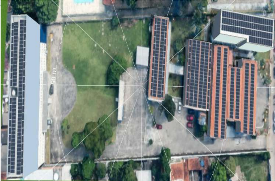
Figura 8 CEP JOSÉ TADROS