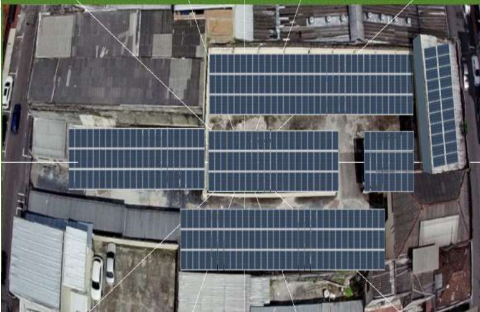
Figura 6 FATESE - ESTACIONAMENTO FACULDADE DE TECNOLOGIA SENAC