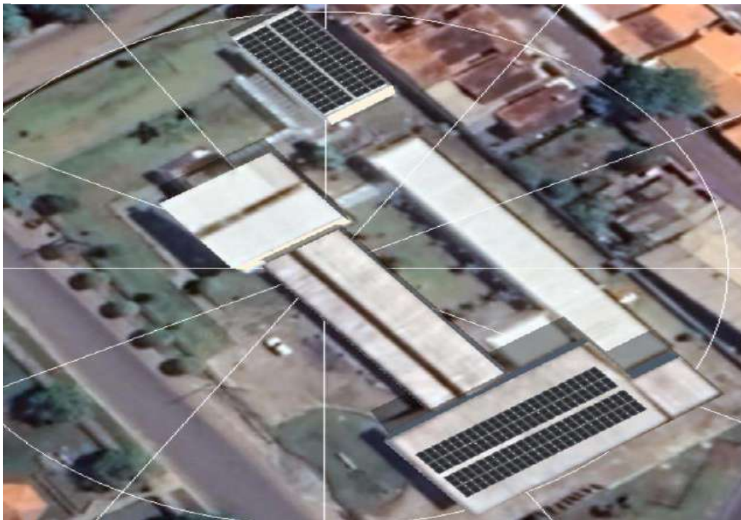
Figura 11 CEP MATHES PENNA RIBEIRO