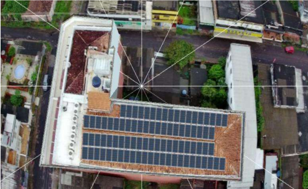
Figura 10 CEP MOYSÉS BENARRÓS ISRAEL