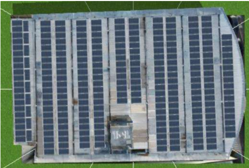
Figura 7 CENTRO ESPECIALIZADO DE INFORMÁTICA