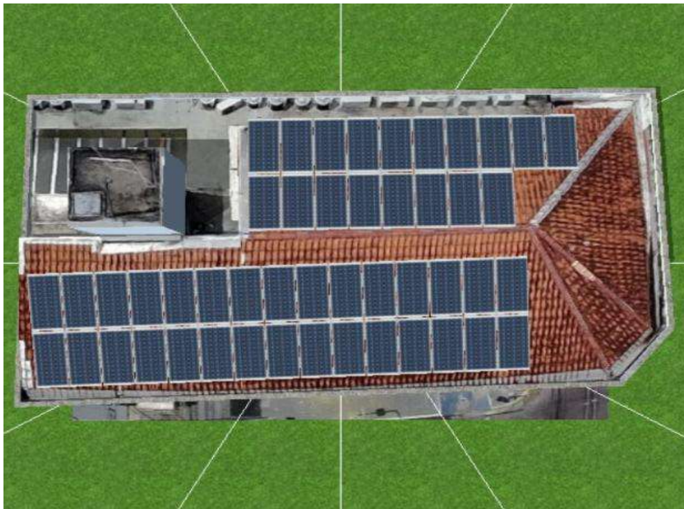
Figura 5 FATESE - FACULDADE DE TECNOLOGIA SENAC